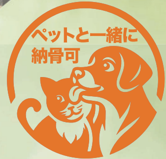
ペットも納骨できる区画は数に限りがあります